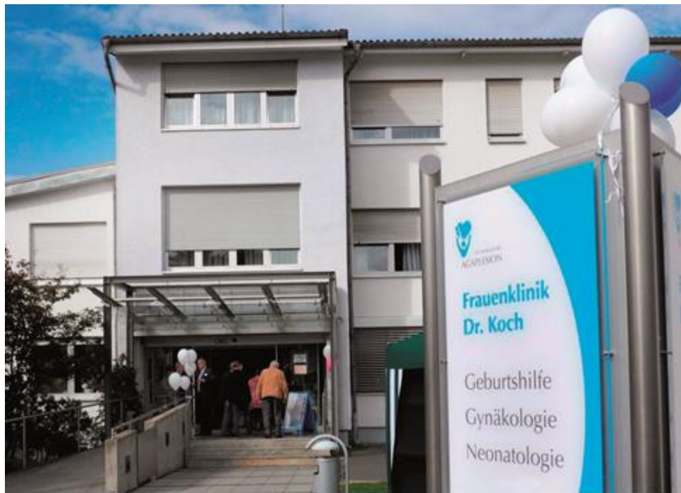
Eingangsbereich der AGAPLESION DIAKONIE KLINIKEN KASSEL, Standort: Frauenklinik Dr. Koch

Link zu weiterführenden Informationen: http://www.agaplesion.de