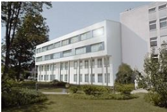
AGAPLESION EV. KRANKENHAUS HOLZMINDEN