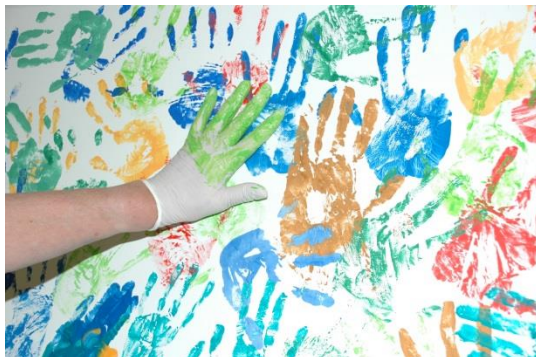
Abb. 12: Dieses farbige Händebild entstand am Aktionstag „Saubere Hände“.