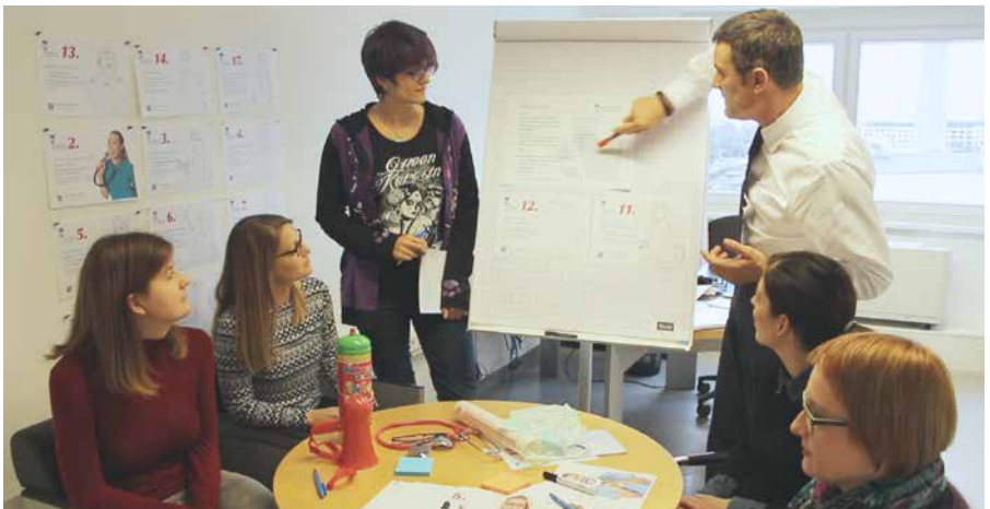
Die Unternehmenskommunikation beim Kreativ-Meeting.

Die Ergebnisse wurden mit Hilfe von Metaplan-Techniken erarbeitet und in Protokollen dokumentiert. Auf diese Weise wurden nicht nur Schlagworte festgehalten. Viel interessanter waren häufig die Gespräche, die zu neuen, nicht geplanten Ergebnissen führten und auf hohem Niveau zusammenfassten, aus welchen, teilweise althergebrachten Quellen sich das Image der Pflegeberufe in der Öffentlichkeit bis heute speist und wie sich das eigentliche Selbstverständnis von Pflegenden heute darstellt.