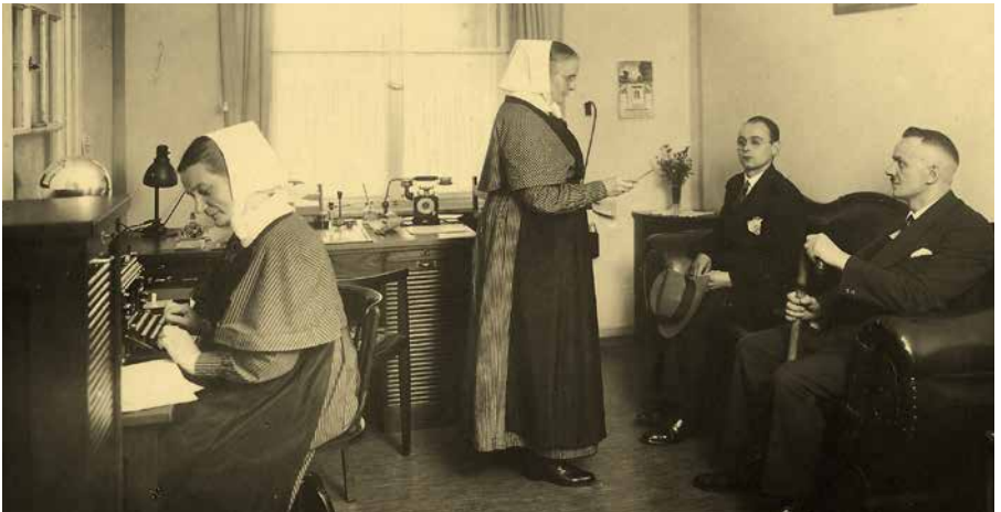
Um 1926: Aufnahme / Pforte in der heutigen AGAPLESION BETHESDA KLINIK ULM

In der evangelischen Tradition bekam die Krankenpflege in Deutschland mit Beginn der Diakonie Mitte des 19. Jahrhunderts einen neuen Schub der Institutionalisierung und Professionalisierung. Es gab kaum Berufe, in denen Frauen ausgebildet wurden und eine eigene Professionalität erlangen konnten. In dieser Zeit begann die Tätigkeit der Diakonissen, die in evangelischen Krankenhäusern die Pflege übernahmen. Gestärkt durch ihre Lebens- und Glaubensgemeinschaft sowie durch ihr professionelles pflegerisches Wissen genossen sie hohes Ansehen. Es gab auch Krankenhäuser, die den Ordensschwwestern gehörten. Hier waren die Ärzte ihre Angestellten.