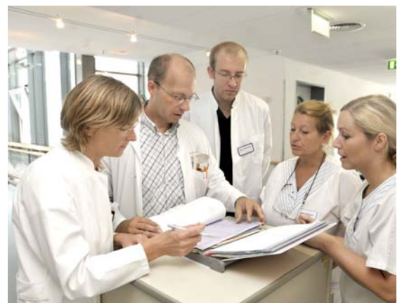
Berufsgruppenübergreifende Besprechung: Der Behandlungsplan wird im Therapeutischen Team individuell für jeden Patienten entwickelt und regelmäßig überprüft und angepasst.