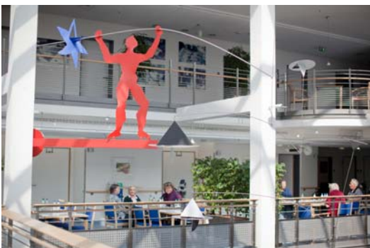
Die helle, offene Architektur des Klinikgebäudes unterstützt die Bewegungsmöglichkeiten.