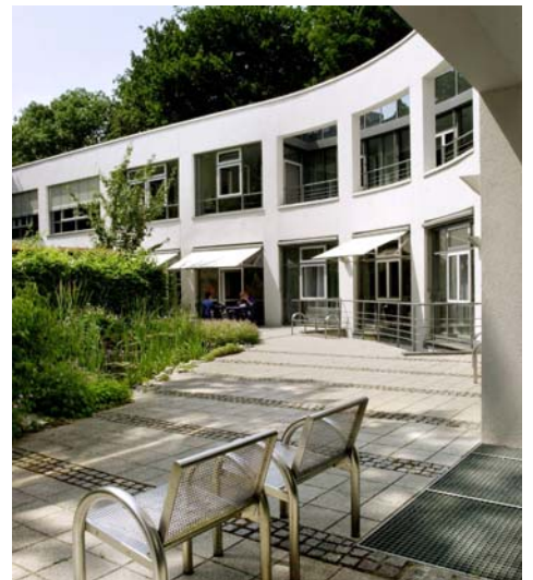
Blick in den Garten der AGAPLESION BETHESDA KLINIK ULM

Bereits vor fast 100 Jahren übernahmen Bethesda-Diakonissen eine Privatklinik auf dem Wallgraben nahe der Donau. Bis zum Jahr 1991 war die Bethesdaklinik ein Belegkrankenhaus mit den verschiedensten medizinischen Disziplinen. Im Jahre 1993 bekam das Krankenhaus in Zusammenarbeit mit dem Ministerium für Arbeit, Gesundheit und Soziales einen neuen Schwerpunkt zugewiesen und wurde zu einer geriatrischen Akutklinik umgewandelt. Das alte Krankenhaus wurde abgerissen und ein Klinikneubau erstellt, der seit der Einweihung im November 1998 mit geräumiger, heller Architektur und einer modernen medizinisch-therapeutischen Ausstattung die Voraussetzungen dafür schafft, Geriatrie nach aktuellen Erkenntnissen und neuesten Forschungsergebnissen zum Wohle der Patienten umzusetzen. Seit 2006 gehört die Klinik nun zum Gesundheitskonzern AGAPLESION – ein Verbund christlicher Einrichtungen im Gesundheitswesen mit Sitz in Frankfurt am Main. Die gemeinnützige Aktiengesellschaft AGAPLESION hält 60% der Anteile, 40% liegen bei der Bethanien Diakonissen-Stiftung.