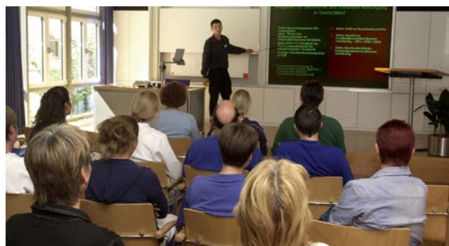
Auf Forschung und Weiterbildung legen wir großen Wert und arbeiten dabei eng mit der Universität Ulm zusammen.