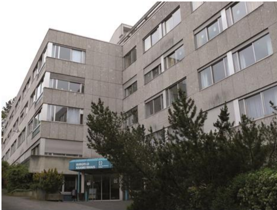
Eingangsbereich der AGAPLESION DIAKONIE KLINIKEN KASSEL, Standort: Burgfeld-Krankenhaus

Link zu weiterführenden Informationen: http://www.agaplesion.de/